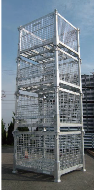
■ 段積み使用時（イメージ）