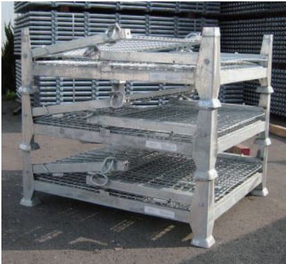
■ 折り畳み時の段積み