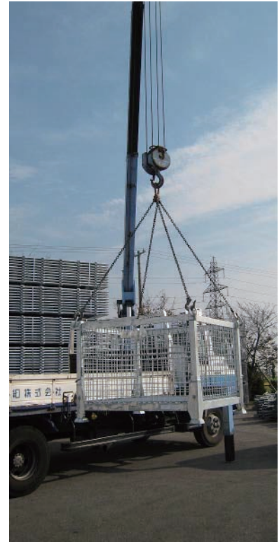
■ ユニックでの作業（イメージ）