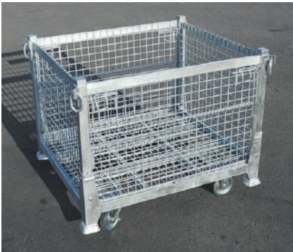
■ キャスター（オプション）を付けた状態